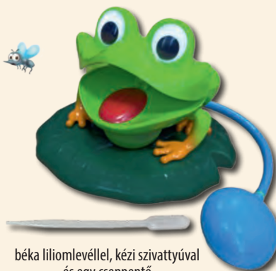
béka liliomlevéllel, kézi szivattyúval és egy cseppentő