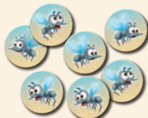
40 žetónov s komármi