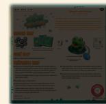
1 pravidlá hry