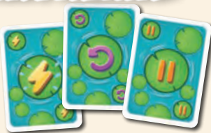
18 kártya: 6 különböző színű szett, mindegyikben 1 kártya támadás, irányváltás és passzolás