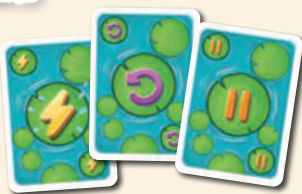
18 Karten: 6 farblich markierte Sets mit jeweils 1 Karte Attacke , Richtungswechsel und Passen