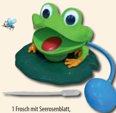
1 Frosch mit Seerosenblatt, Handpumpe und Pipette