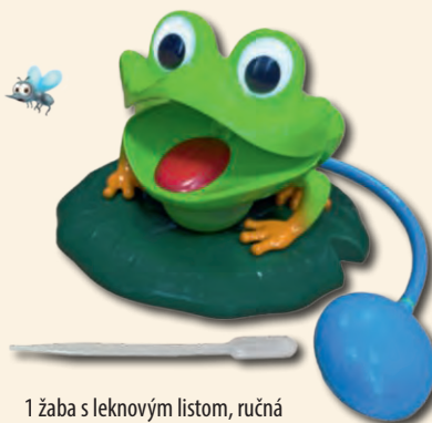
1 žaba s leknovým listom, ručná pumpička a pipeta