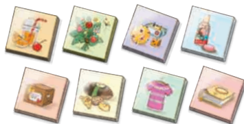
32 Waren (von jeder Art vier Stück)