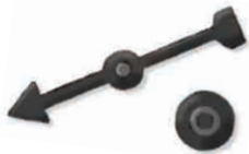
1 Drehfeil mit Befestigungsmaterial