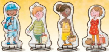
4 Spielfiguren mit Standfüßchen