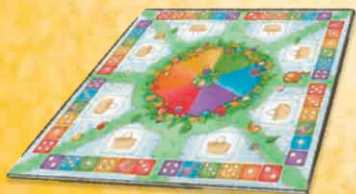
1 Spielplan „Einkaufszentrum“